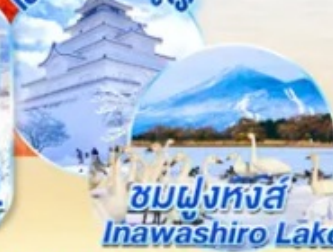
ชมฝูงหงส์ Inawashiro Lake