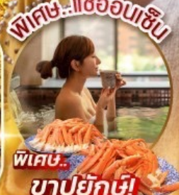
พิเศษ..แซลมอนดิบ ชาบูยักษ์!