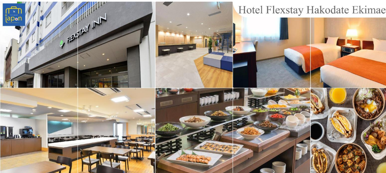
Hotel Flexstay Hakodate Ekimae

FLEX STAY INN HAKODATE EKIMAE หรือเทียบเท่าระดับเดียวกัน