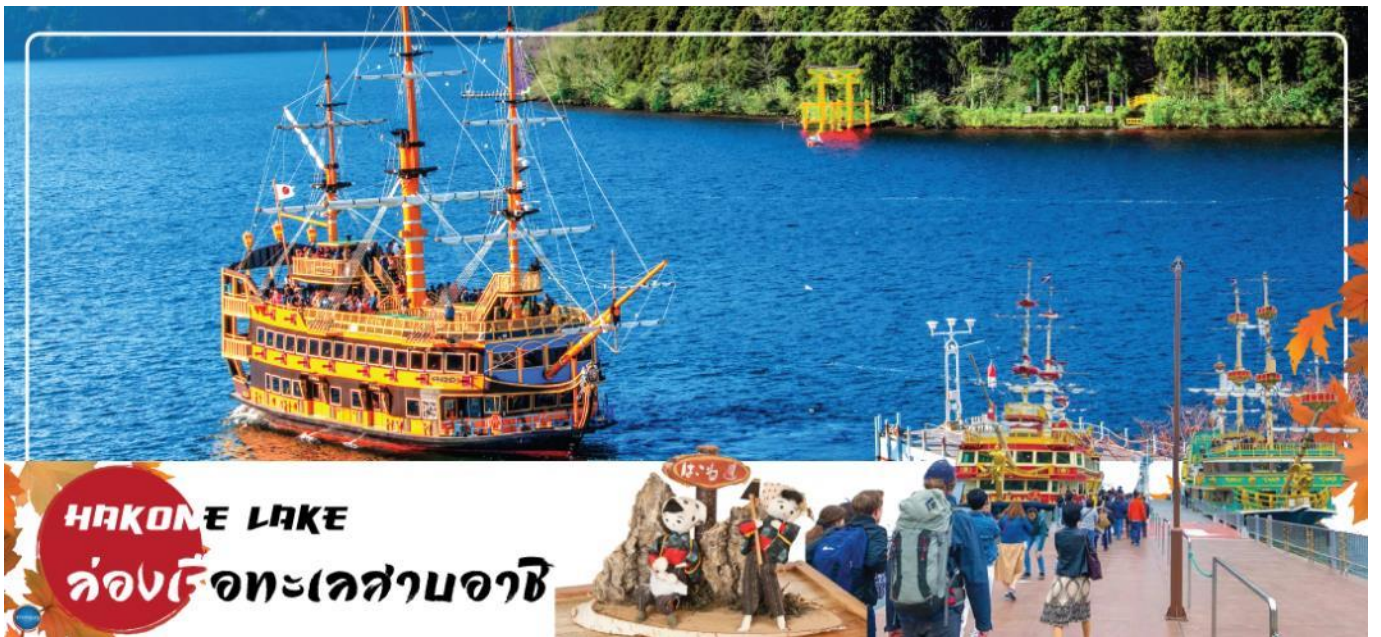
HAKONE LAKE ล่องเรือทะเลสาบอาชิ

วันที่สอง เมืองนาริตะ – เมืองฮาโกเนะ – ล่องเรือโจรสลัด – ถ่ายรูป โทริอิ สีแดงริมทะเลสาบฮาโกเนะ ณ ศาลเจ้าฮาโกเนะ – หุบเขาโอวาคุดานิ – จังหวัดยามานาชิ – หมู่บ้านโอชิโนะซัคไดออนเซ็น + ขาปูยักษ์