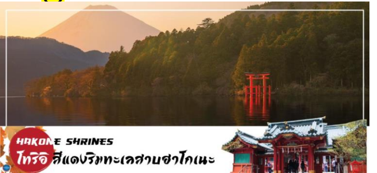
HAKONE SHRINES โทริอิ สีแดงริมทะเลสาบฮาโกเนะ

เที่ยง รับประทานอาหารกลางวัน ณ ภัตตาคาร (2) นำท่าน ชมวิวทะเลสาบ ณ ศาลเจ้าฮาโกเนะ (Hakone Shrines) ศาลเจ้าเก่าแก่ในศาสนาชินโต ตั้งอยู่บริเวณตีนเขาฮาโกเนะ และอยู่ริมทะเลสาบอะชิ จังหวัดคานากาวะ ประเทศญี่ปุ่น ไฮไลท์!!! เสาโทริอิสีแดง ริมทะเลสาบที่เป็นจุดถ่ายรูปยอดนิยม อีสระให้ท่านขอพรและถ่ายรูปตามอัธยาศัย