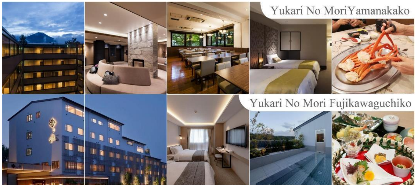
Yukari No Mori Yamanakako

หลังอาหารให้ท่านได้ผ่อนคลายกับการแช่น้ำแร่ธรรมชาติ เชื่อว่าถ้าได้แช่น้ำแร่แล้ว จะทำให้ผิวพรรณสวยงามและช่วยให้ระบบหมุนเวียนโลหิตดีขึ้น