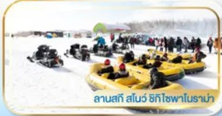
ลานสกี สโนว์ ฮักโซฟาโนราม่า