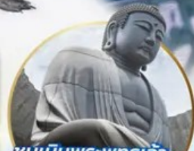
ชมเนินพระพุทธรเจ้า.. Hill of the Buddha

📍 ไฮไลท์!! สนุกสนานกับกิจกรรมทะเลหิมะ ณ ลานสโนว์ เวิลด์ ฮักโซฟาโนราม่า เยี่ยมชมเนินพระพุทธรเจ้า ชมความน่ารักเหล่าสัตว์ ณ สวนสัตว์อาซาฮิยาม่า ชมคลองโอดารุ เข้าชมพิพิธภัณฑ์ทักสโงดอนตริ สัมรสราเมง ณ หมู่บ้านราเมนอาซาฮิคาว่า ช้อปปิ้งจุใจ กาบุกุโคโนจิ อีเมอร์ออย!! บุปเฟ่ต์ซาบุมุ และซาบูยักนิ