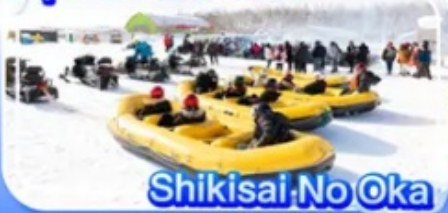
Shikisai No Oka