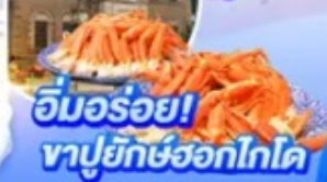
อิมมอร์ออย! มาปูยักซ์ฮอกไกโด