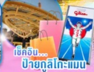
เช็กอิน... ป้ายกูลิโกะแมน

ไฮไลท์!! สัมผัสวัฒนธรรมเมืองอูจิ แหล่งปลูก "ชาเขียวอูจิ" ที่ดีที่สุดในโลก วัดเมียวไดอิน แห่งอูจิเป็นมรดกโลกที่มีประวัติยาวนานหนึ่งพันปี ชม หมู่บ้านมรดกโลกการันตีโดย UNESCO ณ หมู่บ้านชิราคาวาโกะ ช้อปปิ้งจุใจ ย่านซากาเอะ ย่านชินโซบาชิจิ ป้ายกูลิโกะแมน แห่งโดทงโบริ