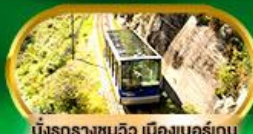
นั่งรถรางชมวิว เมืองเบอร์เกน