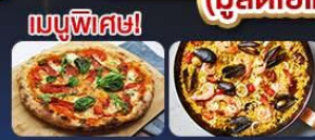
เมนูพิเศษ!