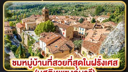
ชมหมู่บ้านที่สวยงามที่สุดในฝรั่งเศส (มุสตีเยแซงท์มารี)