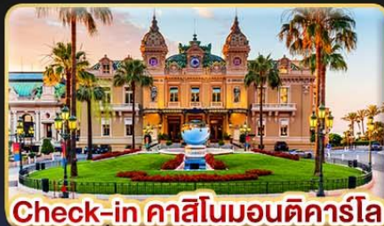
Check-in คาสิโนมอนติคาร์โล