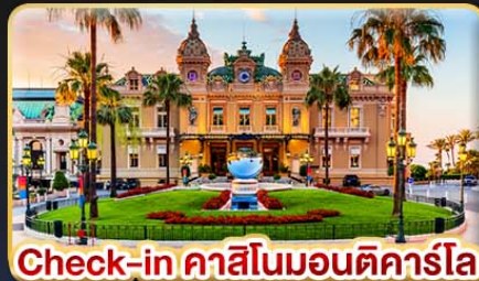
Check-in คาสิโนมอนติคาร์โล