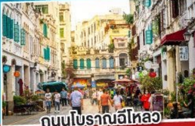
ถนนโบราณอีไหลว