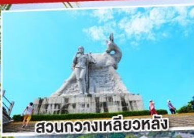
สวนกงวางเหลียวหลิง