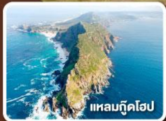
แหลมกู๊ดโฮป