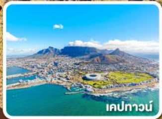
เคปทาวน์