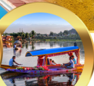
ล่องเรือซิคาร์่า