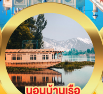
นอนบ้านเรือ วิวเขาหิมาลัย