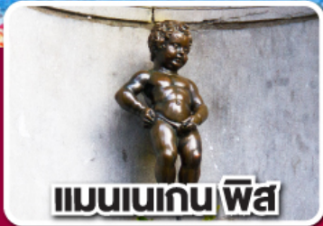
แมนเนเกน พิส