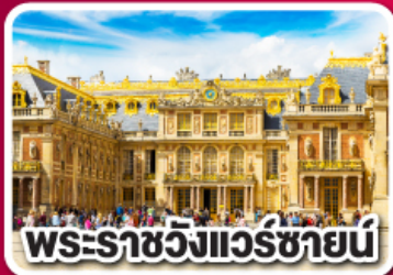
พระราชวังแวร์ซายน์