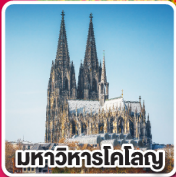
มหาวิหารโคโลญ