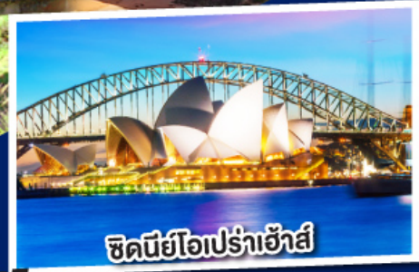
ซิดนีย์โอเปร่าเฮ้าส์