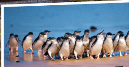
ชมความน่ารักตามธรรมชาติของ ขบวนเพนกวินพาเหรด ณ เกาะฟิลลิป