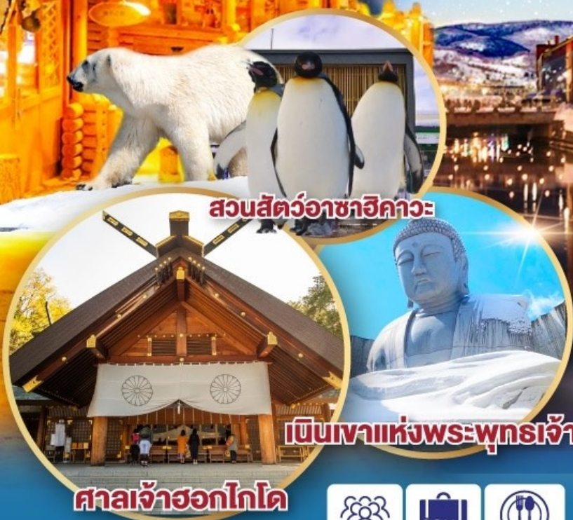
สวนสัตว์อาซาฮิกาวะ