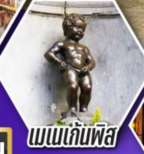
แมนเกินฟิส