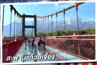
สะพานแกวล์เจียง