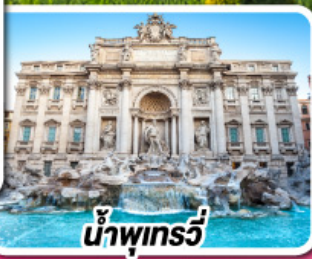
น้ำพุทรี