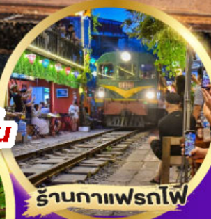
ร้านอาหารเฟรทไฟ