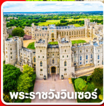
พระราชวังวินเซอร์

พักผ่อนนอน 4 คืนและ อิสระให้ท่านได้เที่ยวลอนดอนแบบเต็มอิ่ม 1 วัน