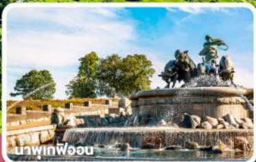
น้ำพุเทพีออส