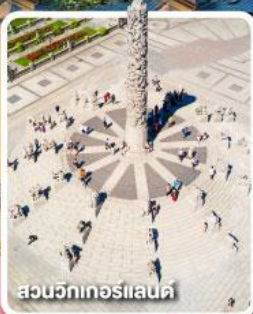
สวนวิกทอเรียแลนด์