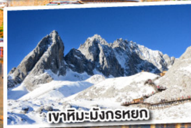
เขาสหิมะมังกรหยก