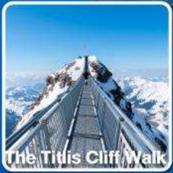
The Titlis Cliff Walk