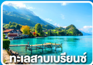
ทะเลสาบเบรียนซ์