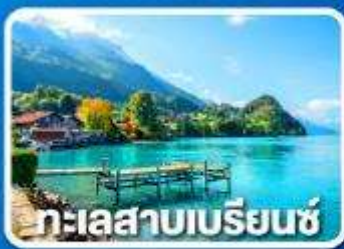
ทะเลสาบเบรียนซ์