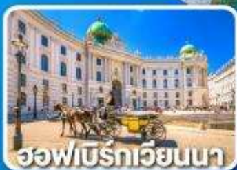
ฮอฟบวร์กเวียนนา