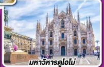
มหาวิหารดูโอโม