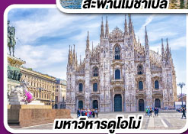
มหาวิหารดูโอโม