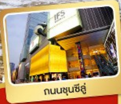
ถนนชุนชิลู๋