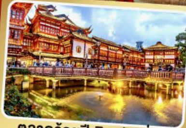
ตลาดร้อยปีเจิ้งหวังเมี่ยว