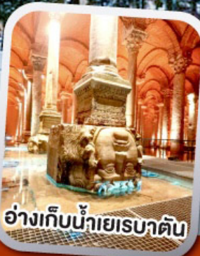
อ่างเทิบน้ำเยเรบาตัน