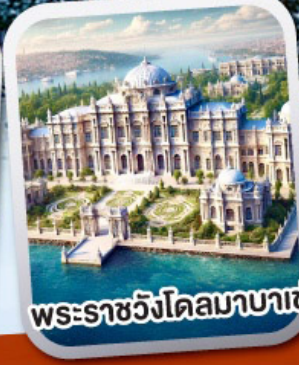
พระราชวังโดลมาบาเซ