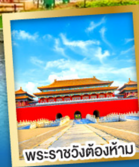
พระราชวังต้องห้าม