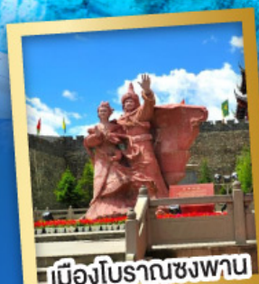
เมืองโบราณชงวาน