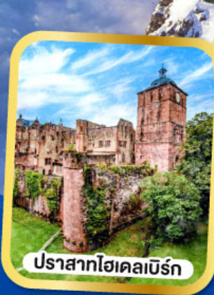
ปราสาทไฮเคลเบิร์ก