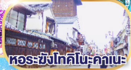
หอรังโทคิโนะคานะ