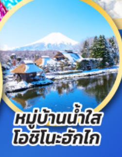
หมู่บ้านน้ำใส ไอชิโนะอึกิโกะ