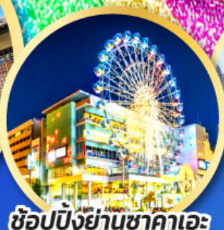
ช้อปปิ้งย่านซากาเอะ