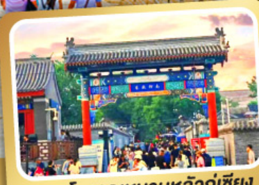
ถนนโบราณหนานหลวู่เก๋เซียง