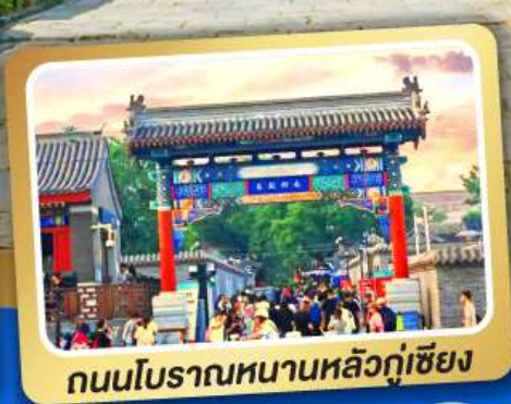
ถนนโบราณหนานหลิวกู่เซียง