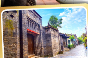
ถนนคนเดินชอยกว้างชอยแคบ