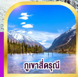
ภูเขาสัตร์ณี