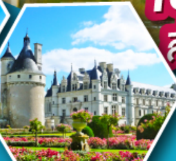
ปราสาทเชอนงโซ

เข้าชมมหาวิหารมรดกแห่งต์มิเชล สิ่งมหัศจรรย์ของประเทศฝรั่งเศส