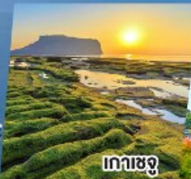
เกาะเชจู