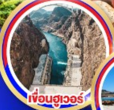
เฟือนฮูเวอร์

ช้อปปิ้งจุใจเอ้าท์เล็ตออนตารีโอมีลส์ ช้อปปิ้งบาร์สไควเอ้าท์เล็ต