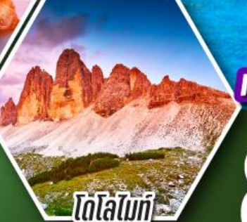
โตโลไมท์