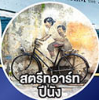
สตรีทอาร์ต ปีนัง