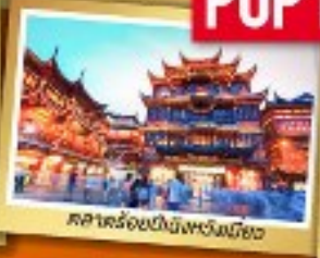
ศาลาร้อยปีเมืองหนิงเฉียว