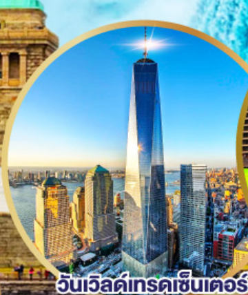
วันเวิลด์เทรดเซ็นเตอร์