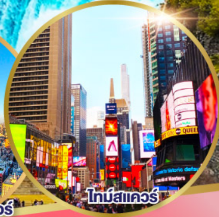
ไทม์สแควร์