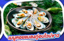
เมนูหอยแมลงภู่อบไวน์ขาว