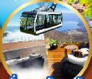
นังกระเช้าอุซุซัง

พิเศษ!! บุฟเฟ่ต์ร้าน NANDA ดีที่สุดในซัปโปโร