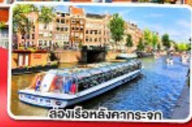
ล่องเรือหลังคากระจก