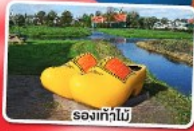
รองเท้าไม้