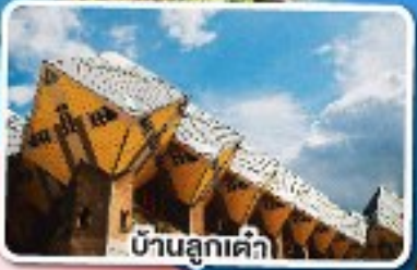
บ้านลูกเต้า