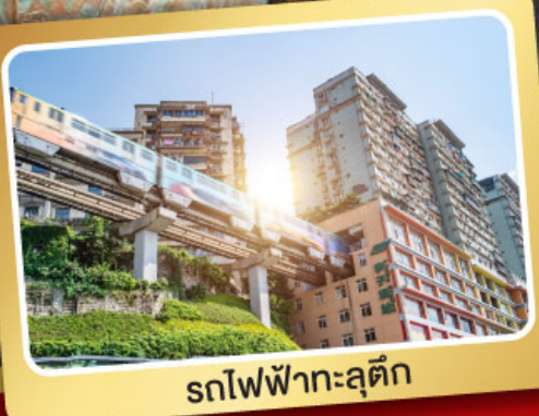
รถไฟฟ้าทะลุตึก