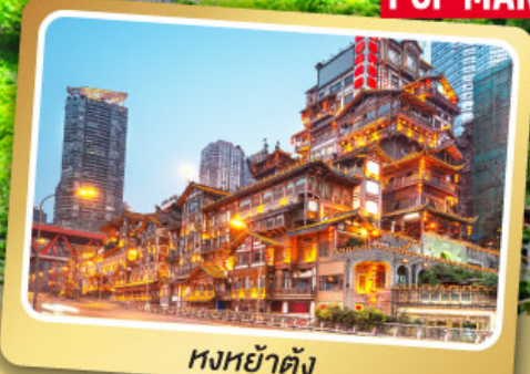
หงหย่าตั้ง