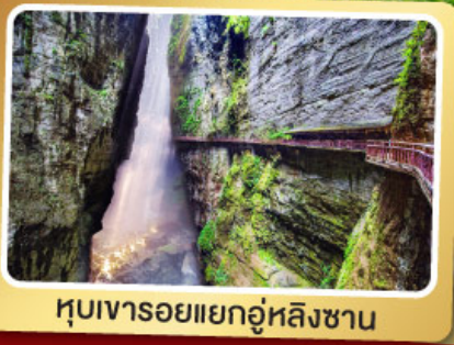
หุบเขารอยแยกอู่หลิงซาน