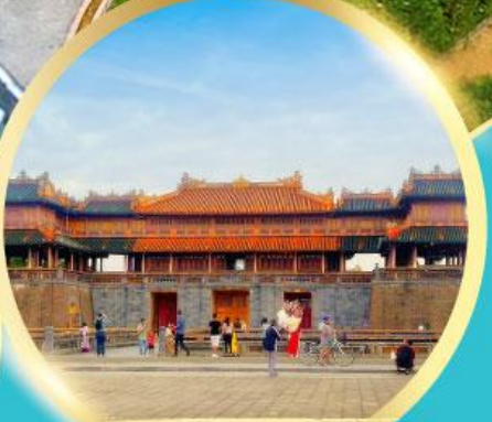
พระราชวังโบราณโคโทยา