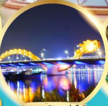
สะพานมังกรพันไฟ