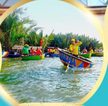
ส่องเรือกระดัง