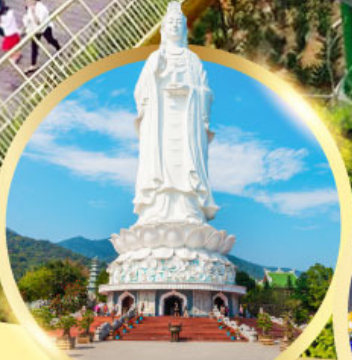
วัดหลิงอิ่ง