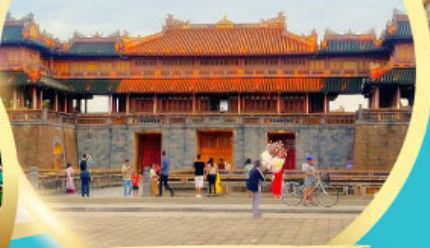
พระราชวังโบราณไดโน