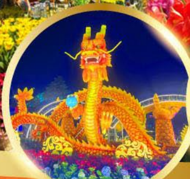
สะพานมังกรพันไฟ