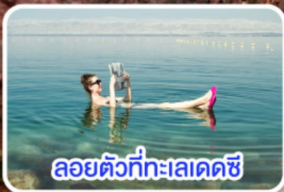
ลอยตัวที่ทะเลเดดซี