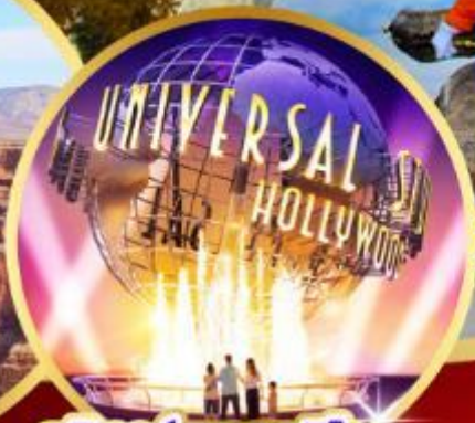
ยูนิเวอร์แซลสตูดิโอ