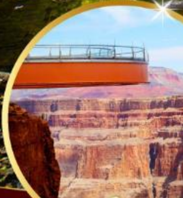
แกรนด์แคนยอน Sky walk