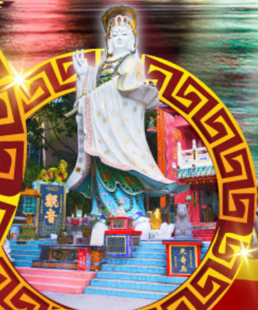
เจ้าแม่กวนอิม ทาดริ์ฟส์ลีย์